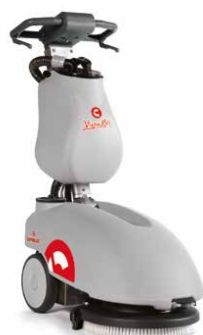
Vispa 35 B