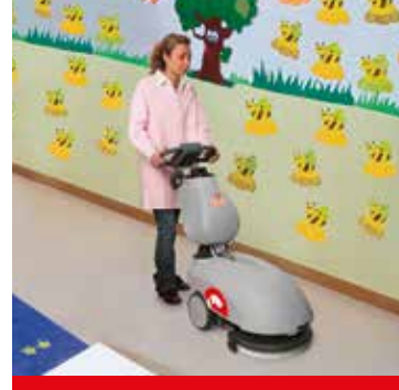
Vispa 35 E-B-BS Systèmes d'entretien automatisés pour petites surfaces