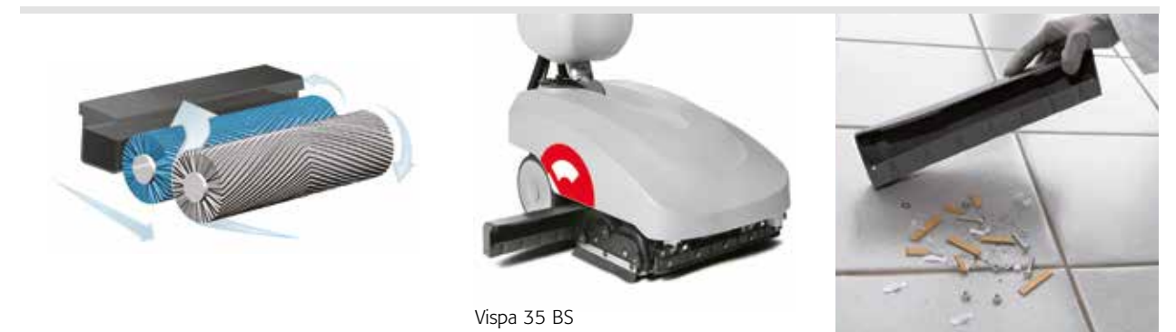
Vispa 35 BS Le bac de ramassage s'enlève très facilement pour vider les petits déchets recueillis

Vispa 35 BS peut également nettoyer sous les étagères ou les éléments se trouvant à 35 cm du sol grâce, au design du réservoir de solution au barycentre très bas.