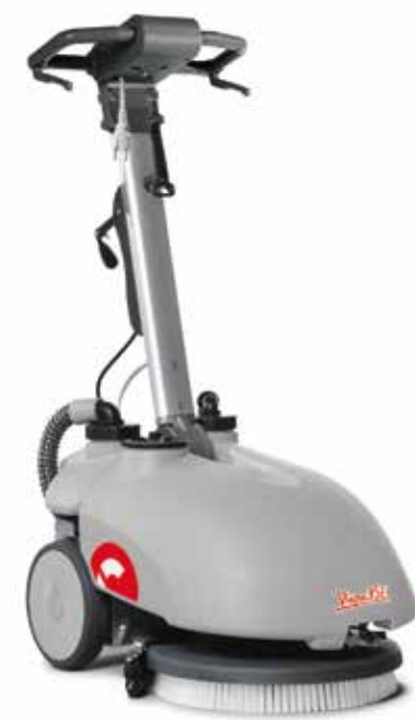
Vispa 35 E