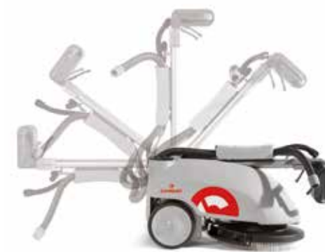
Une flexibilité de 180°

de petites dimensions et encombrés. Vispa 35 est fournie avec des brosses ou un disque entraîneur. La version à batterie dispose d'un chargeur de batterie incorporé et d'une batterie gel. La version électrique peut être fournie sur demande avec un câble de 15 m.