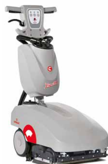
Vispa 35 BS