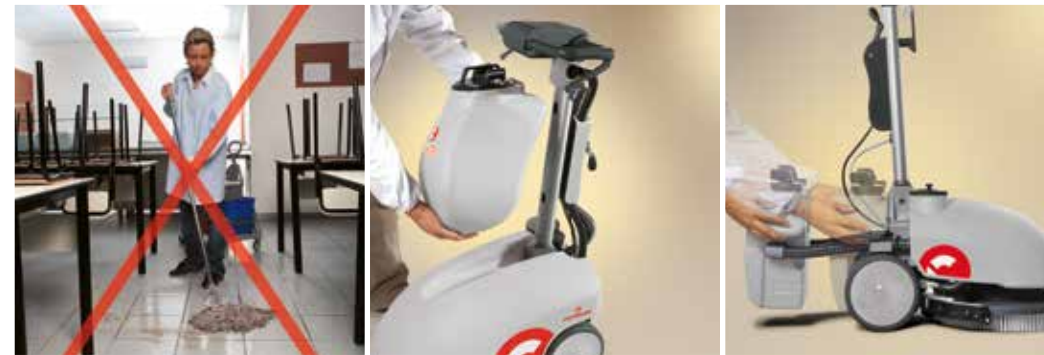
Vispa 35 B-BS