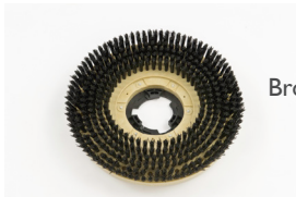
Brosse standard (noire)