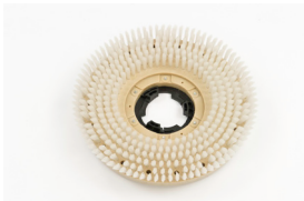
Brosse souple (blanche)