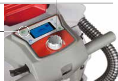
Tableau de bord version avec traction