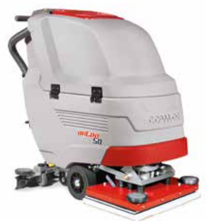
Antea 50 BTO Orbital