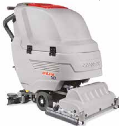
Antea 50 BTS