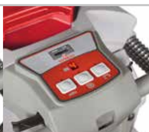
Panneau de commande version B