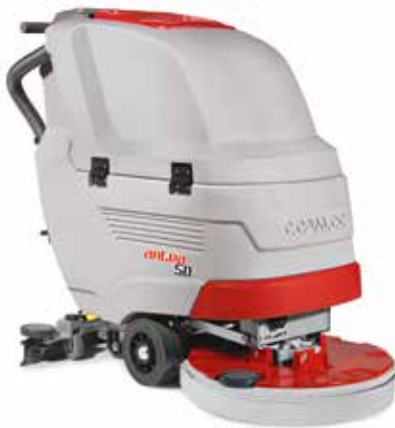
Antea 50 E/B/BT