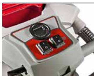
Panneau de commande version E