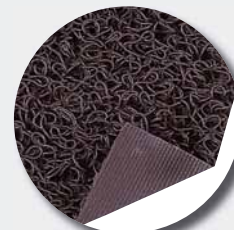
Thibaude pleine (10 mm)