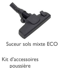
Suceur sols mixte ECO