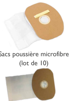
Sacs poussière microfibre (lot de 10)